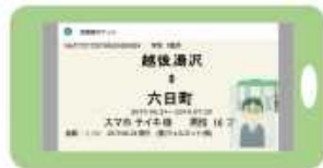
「スマホ定期券」画面イメージ。 ※イメージであり、今後変更になる可能性があります。